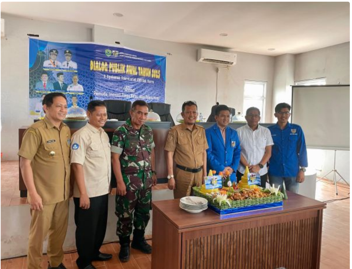
Dewan Pimpinan Daerah (DPD) II Komite Nasional Pemuda Indonesia (KNPI) Kabupaten Barru menggelar acara Dialog Awal Tahun yang juga diisi dengan syukuran atas pindahnya sekretariat baru di Gedung Pemuda

BARRU– Dewan Pimpinan Daerah (DPD) II Komite Nasional Pemuda Indonesia (KNPI) Kabupaten Barru menggelar acara Dialog Awal Tahun yang juga diisi dengan syukuran atas pindahnya sekretariat baru di Gedung Pemuda, Lantai 4. Kegiatan ini dihadiri oleh berbagai perwakilan organisasi kepemudaan (OKP) dan